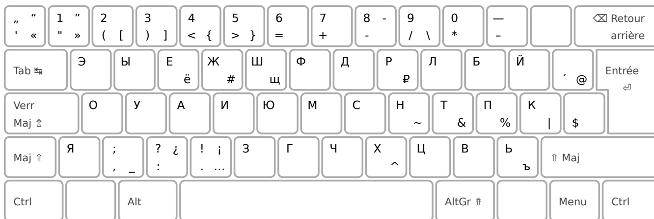
Disposition pour le russe sur clavier standard